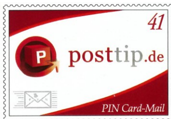
WE GS A Nr. 3

Es gab zur Messe einen Sonderstempel (Abb. siehe Kapitel 9) der 30.09. bis 03.10.2006 im Einsatz war.