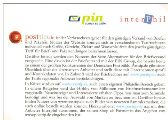
GS A Nr. 3 – Bildseite