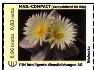
PBE Nr. 39