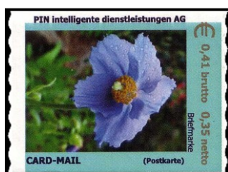
PBE Nr. 37