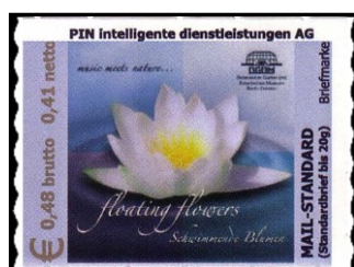
PBE Nr. 38