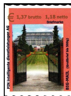
PBE Nr. 40

Zu dieser Ausgabe gab es sowohl eine Ersttags-Klappkarte (2.500 Stück) als auch einen Ersttagsstempel (EST PBE Nr. 7).