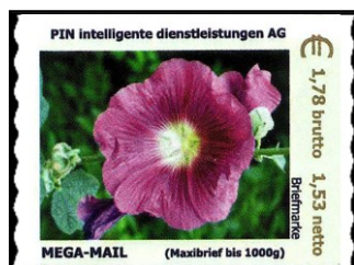
PBE Nr. 41